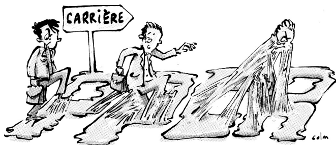
Grille d'avancement des professeurs agrégés classe normale, avant et après le 01/09/2017

Le nouveau rythme d'avancement unique modifie cette organisation.